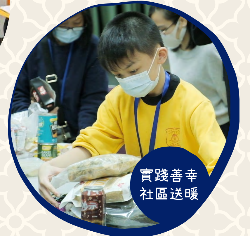
實踐善幸 社區送暖