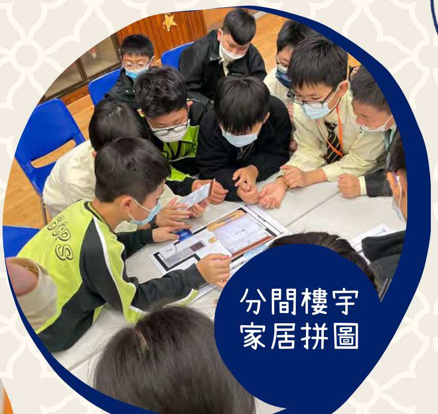
分間樓宇 家居拼圖