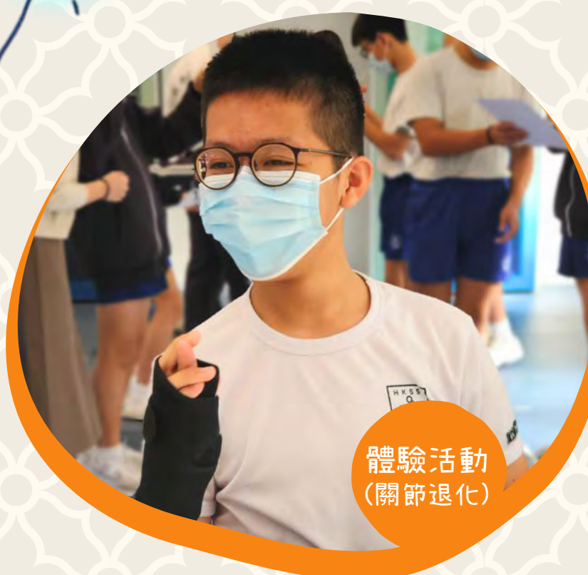
體驗活動 (關節退化)