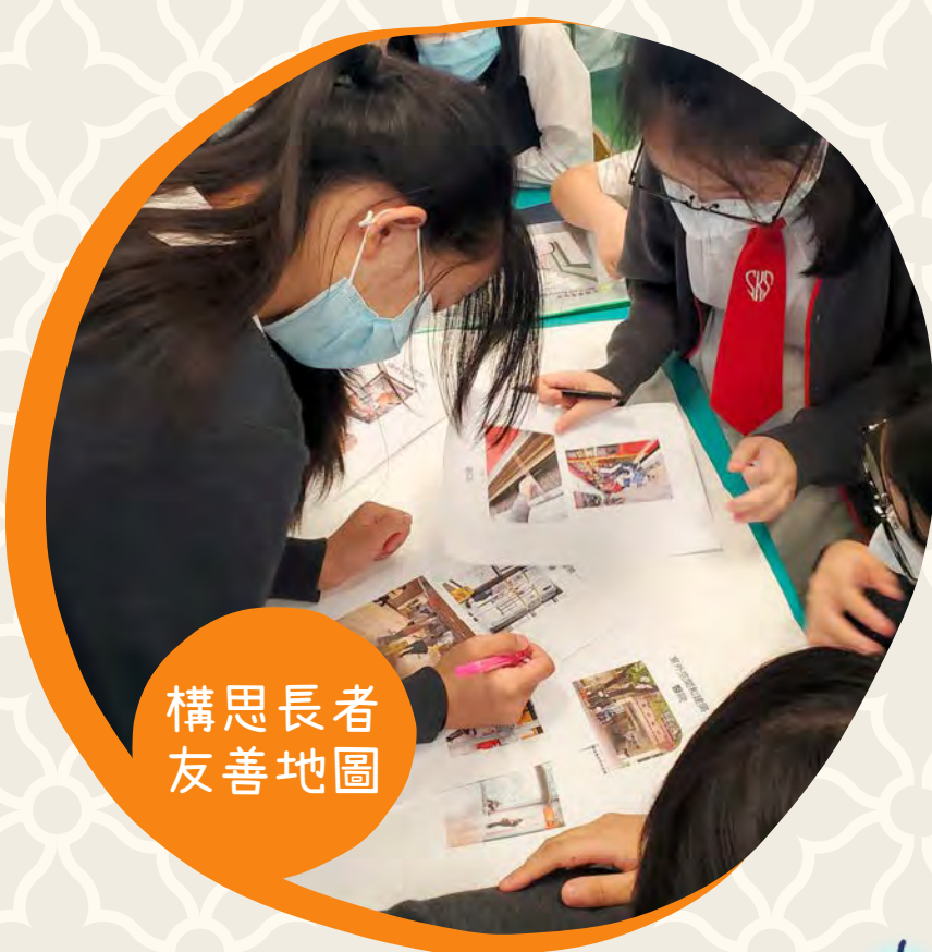
構思長者友善地圖