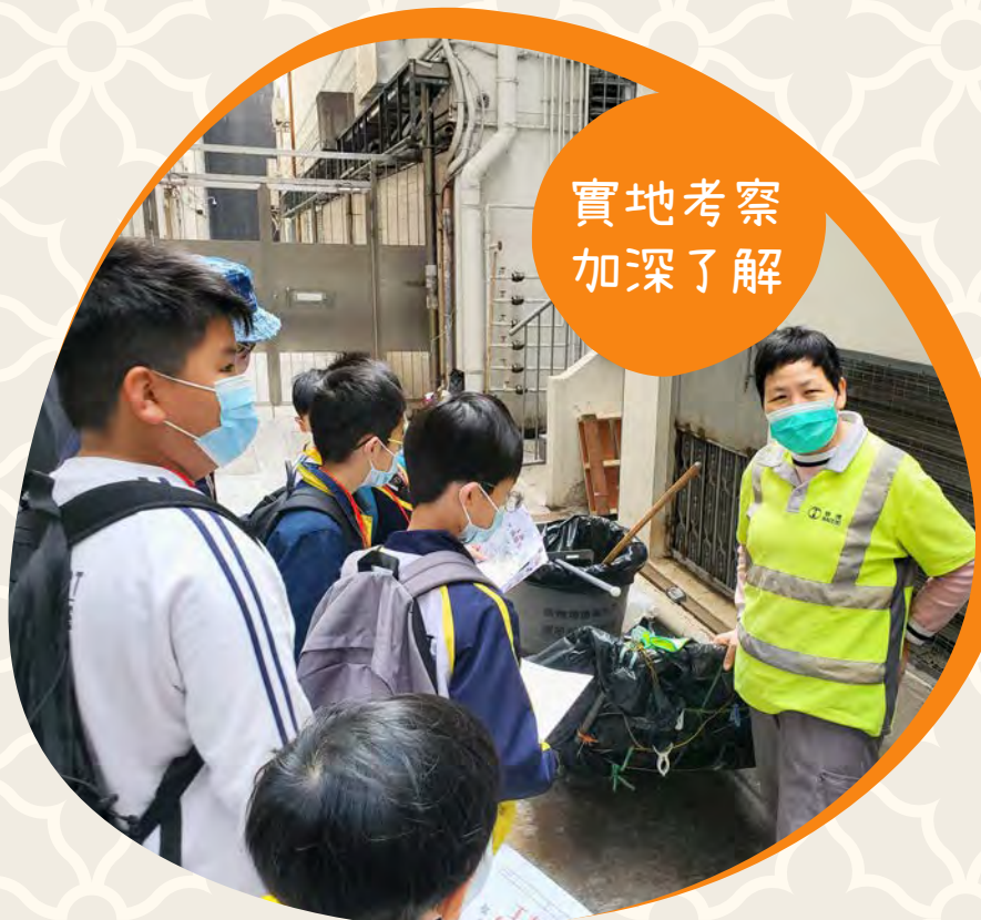
實地考察 加深了解