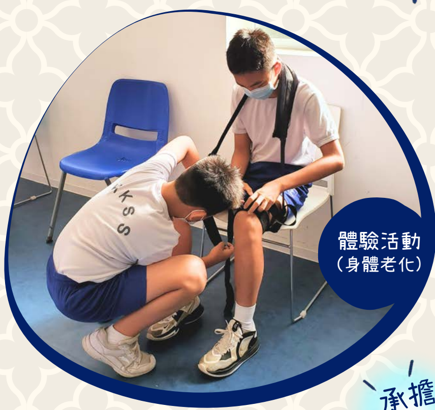
體驗活動 (身體老化)